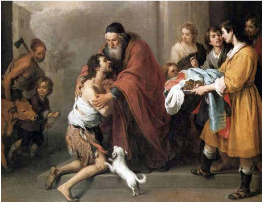
Toen kwam hij tot inkeer...